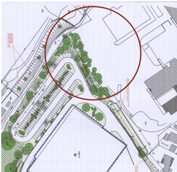
Abb. 4: Ausschnitt aus dem derzeit rechtswirksamen Bebauungsplan (ohne Maßstab)

Der Bebauungsplan „Hundsrück“ setzt, wie den nachfolgenden Abbildungen zu entnehmen ist, die im Anschluss an den Erweiterungsbereich bereits vorhandene Nutzung als Parkfläche fort