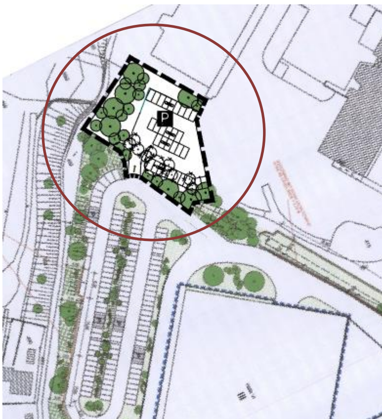
Abb. 5: Ausschnitt Deckblattänderung (ohne Maßstab)