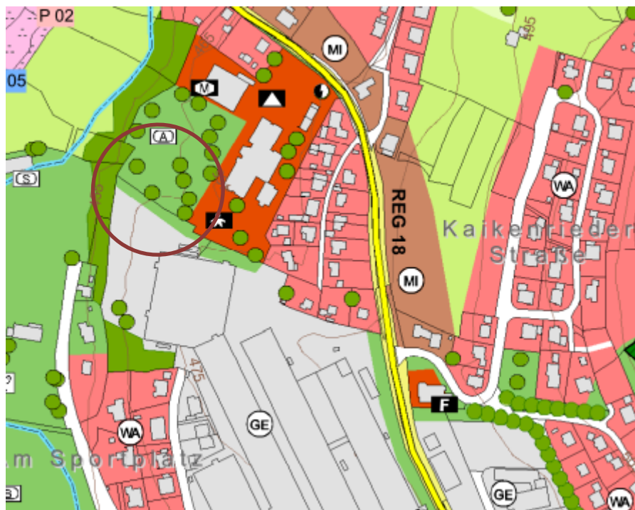
Abb. 2: Ausschnitt aus dem derzeit rechtswirksamen Flächennutzungsplan (ohne Maßstab)

Im Zuge des Parallelverfahrens wird der Geltungsbereich in Gewerbegebietsfläche geändert